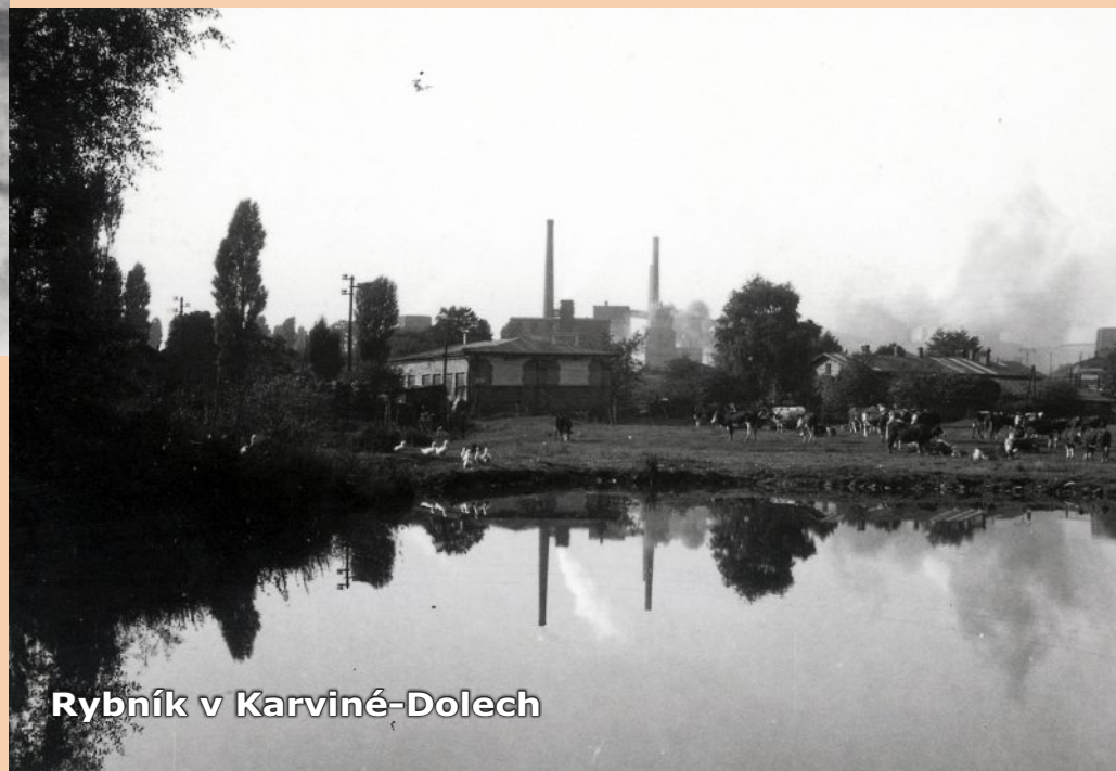
Rybník v Karviné-Dolech