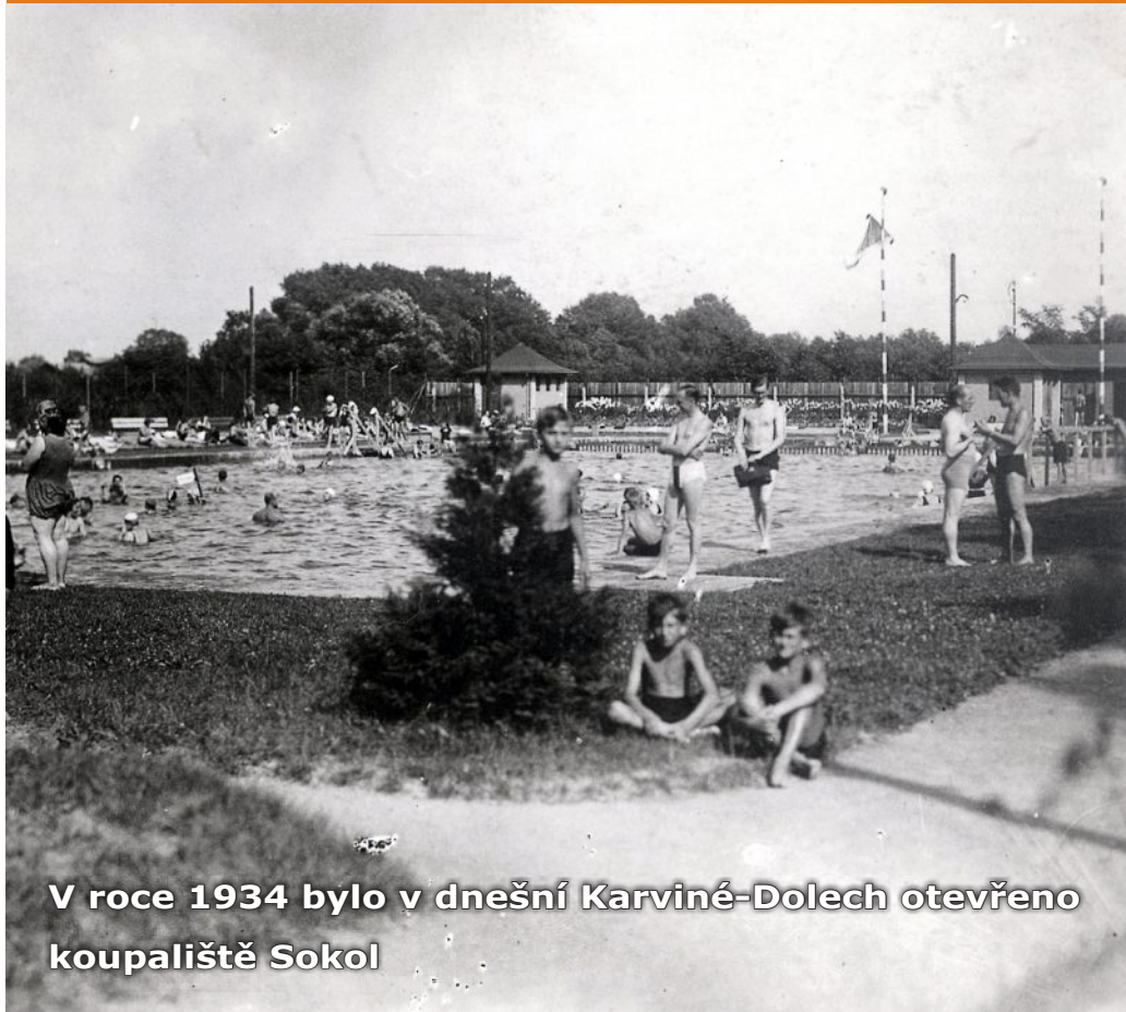
V roce 1934 bylo v dnešní Karviné-Dolech otevřeno koupaliště Sokol